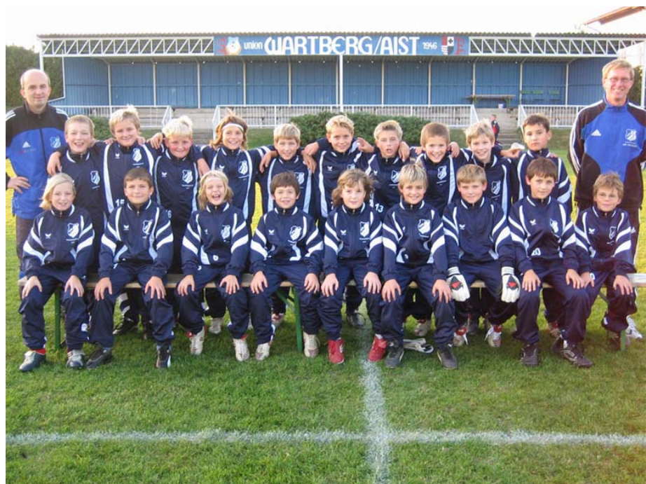
Tabelle Herbst 2005 – U-11 (Mühlviertel Ost U11 Gruppenliga Süd):