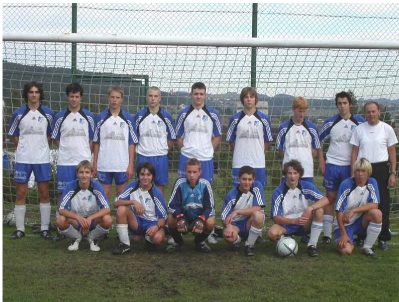
Tabelle Herbst 2004 – U-17 (Regionliga Nord-Ost U17):

Im vergangenen Herbst legte die U-17 meist passable Leistungen ab, ließ jedoch in einigen Spiele Punkte etwas leichtsinnig liegen – auch gegen das Führungsduo wären durchaus Siege möglich gewesen. Des reichte es „nur“ für Platz 3. Im Frühjahr ist auf alle Fälle mehr drin!