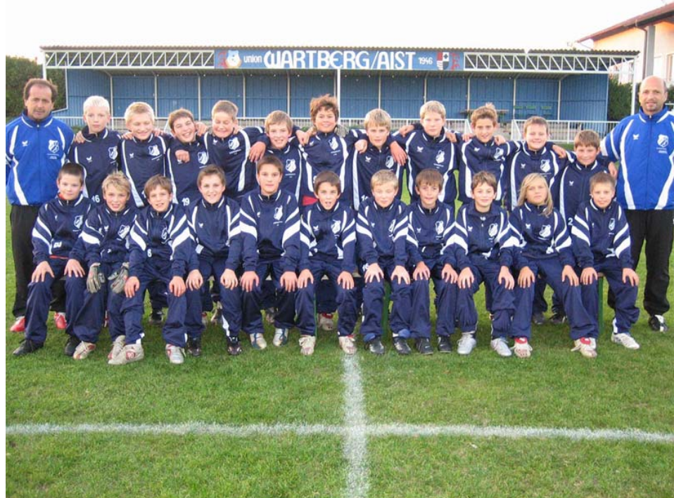
Tabelle Herbst 2005 – U-13 (Mühlviertel Ost U13 Gruppenliga):