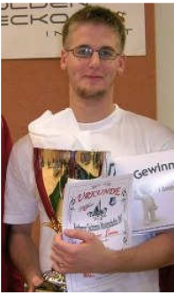
Sieger 2007: Asanger S.